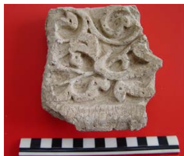
تصویر ۱۴. کتیبه مادر و فرزند در بنای امام‌زاده فضل‌بن‌سهل (نگارندگان).

نکته‌ای که در این بخش قابل تأمل است، وجود قطعه‌ای از کتیبه‌هاست که به‌گمان بسیار، در آن دو خط بزرگ و کوچک که شاید دو متن متفاوت هم داشته باشند، در یک سطح (بالا و پایین یکدیگر) اجرا شده‌اند (تصویر ۱۴). این نوع نقش که در دوره ایلخانی به نقش تزئینی مادر و فرزند معروف است (شامل دو ردیف کتیبه که در دل یکدیگرند)، به‌گمان بسیار در این مکان همانند گنبد سلطانیه (حدود ۷۱۰ ه.ق.)، بقعه پیربکران (۷۱۲ ه.ق.)، مسجد جامع ابرقو (۷۳۸ ه.ق.) و... به اجرا درآمده است.