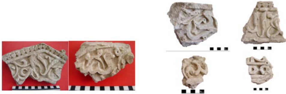
تصاویر ۱۲. کتیبه‌های به‌کاررفته در بنای امام‌زاده فضل‌بن‌سهل آوه (نگارندگان).

خود باعث جلوه بخشیدن هرچه بیش‌تر به کتیبه‌ها می‌شد. متأسفانه کتیبه‌های به‌کاررفته در تزئینات بنای امام‌زاده فضل‌بن‌سهل، در وضعیت مناسبی برای تشخیص نوع خط و شیوه تزئینی آن نیستند (تصاویر ۱۲). نگارنده تنها براساس حدس و گمان و نیز بر این اساس که خطوط به‌کاررفته در تزئین کاشی‌های زرین‌فام یافته شده این بنا، از نوع ثلث و نسخ هستند (تصاویر ۱۳)، به نتایجی رسیده است.