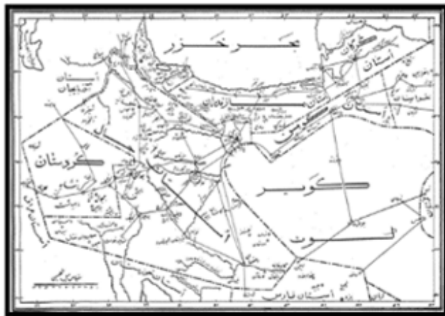
نقشه ۱. آوه در نقشه استان جبال و گیلان و مازندران (اطلس تاریخی ایران، ۱۳۵۰).