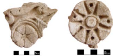
تصاویر ۶. تزئینات گل چندپیر در گچ‌بری‌های امامزاده فضل‌بن‌سهل آوه.