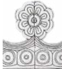
تصویر ۷. نقش تزئینی روزت در تزئینات گچ‌بری ساسانی (پوپ، ۱۳۸۷: ۷۷۱).

از جمله نقوش گیاهی دیگر در تزئینات گچ‌بری امامزاده فضل‌بن‌سهل آوه، گل‌های شش یا هشت پری است که محیط در نقوش چندضلعی، به تصویر کشیده شده‌اند (تصاویر ۶). این نوع نقوش که معرّف تمامی باستان‌شناسان و محققین هنر تزئیناتی سرزمین ایران هستند، از جمله نقوش پرکاربرد و با پیشینه هنری بسیار در تزئینات وابسته به هنر معماری ایران محسوب می‌شوند (تصویر ۷).