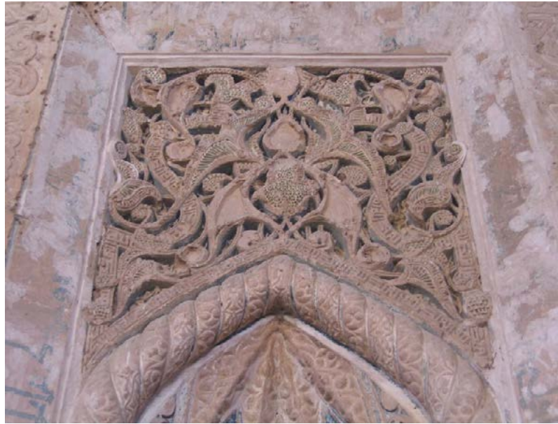
تصویر ۲. بخشی از تزئینات گچی با برجستگی زیاد؛ محراب مسجد جامع اشترگان (صالحی کاخکی و اصلانی، ۱۳۹۰: ۹۹).