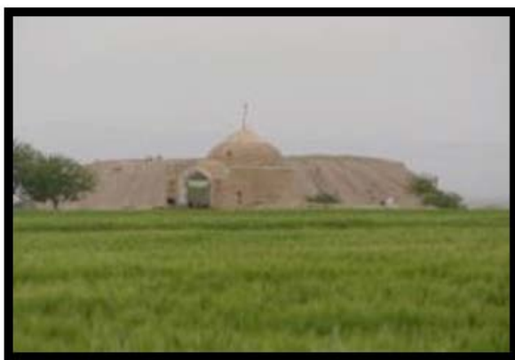
تصویر ۱. امام‌زاده فضل‌بن‌سلیمان در ضلع شرقی محوطه آوه (خطیب شهیدی، ۱۳۸۵).

یکی از یافته‌های بااهمیت و شاخص در محوطه آوه که در جریان نجات‌بخشی امام‌زاده فضل‌بن‌سلیمان در فصل سوم کاوش‌های محوطه تاریخی در سال ۱۳۸۸ ش. به دست آمد (تصویر ۱)، تزئینات گچ‌بری بود.